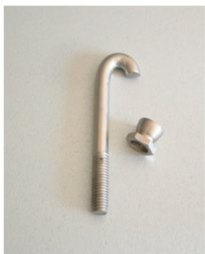
Spec. varžtais ir veržlėmis

Suvirintos vielos tinklo panelės tvirtinimo prie stulpo būdai: